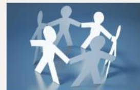
Fagutvalg, arbeidsgrupper og samarbeidsprosjekter.