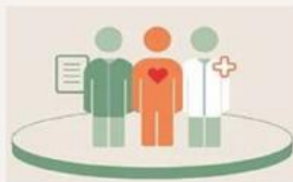
Helsefelleskapet i Vestfold